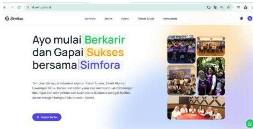
Gambar 6: Pengisian Tracer Study dilakukan melalui SIMFORA