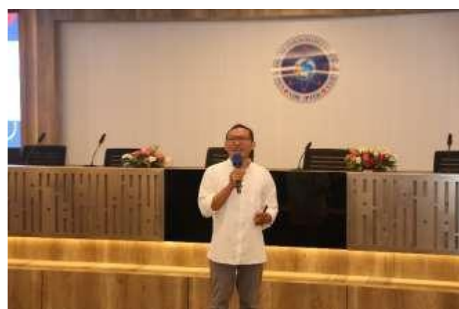
Gambar 2: Kabid AKPS menjelaskan mekanisme pelaksanaan Tracer Study 2024