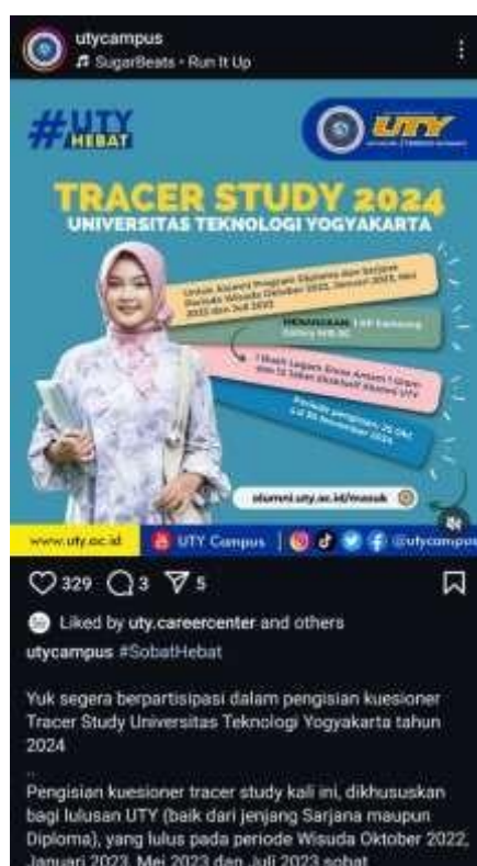
Gambar 4: Info pelaksanaan Tracer Study 2024 di IG utycampus

Untuk menjangkau semua responden, pelaksanaan Tracer Study 2024 disosialisasikan melalui akun Insagram resmi UTY Campus dan UTY Career Center sebagai berikut,