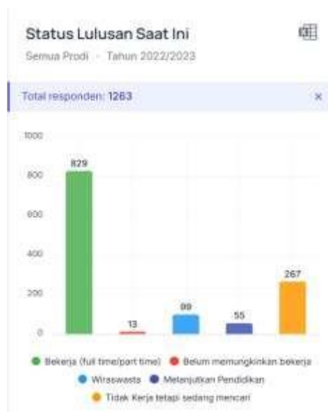
Tabel 1: Alumni Yang Berkarier di Perusahaan Internasional