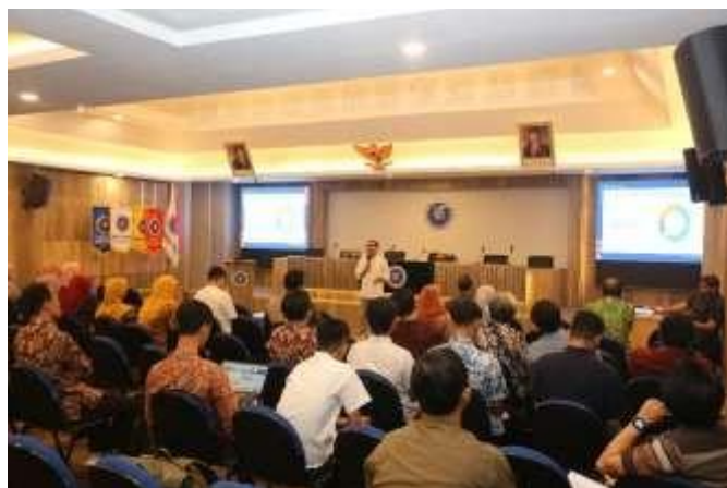
Gambar 3: Kegiatan ini dihadiri oleh Dekan, Wakil Dekan, dan Kaprodi