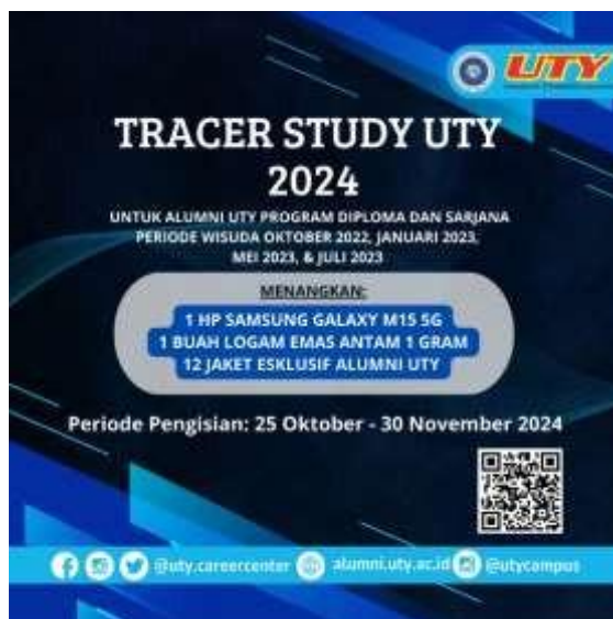
Gambar 5: Flyer Pelaksanaan Tracer Study UTY tahun 2024 di IG utycareercenter