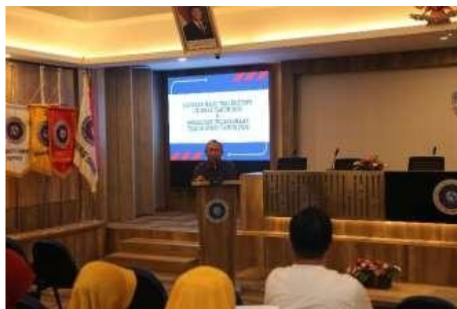
Gambar 1: Wakil Rektor 3 Memberikan Sambutan

https://uty.ac.id/article/uty-gelar-sosialisasi-pengisian-tracer-study-2024